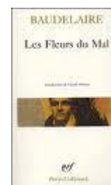
Un recueil de poèmes