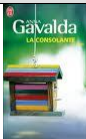
Un recueil* de nouvelles*