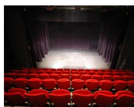
Une pièce de théâtre