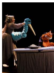
Une pièce de théâtre*