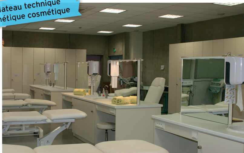
Plateau technique esthétique cosmétique

Accessible après la 3 e , ce baccalauréat forme à un métier en 3 ans et peut conduire à une poursuite d'études