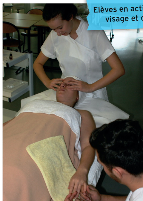
Elèves en activité soin du visage et des mains