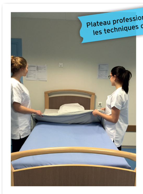
Plateau professionnel pour les techniques de soins

Accessible après la 3 e , ce baccalauréat forme à un métier en 3 ans mais surtout à une poursuite d'études