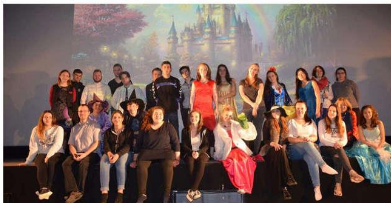
Accompagnés par leurs professeurs et le cinéma, les élèves ne manquent pas d'imagination.

Ayant accompagné leur prestation pour un spectacle à la Hal-