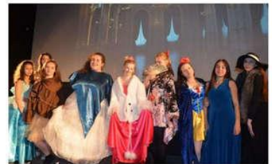
Des princesses charmantes. Et drôles.