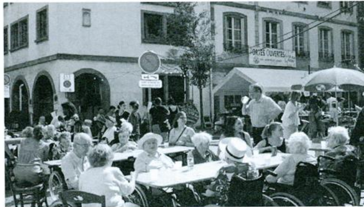
Les élèves du lycée Cassin ont accompagné leurs aînés de la maison de retraite Emmaüs, leur permettant de participer aux festivités.