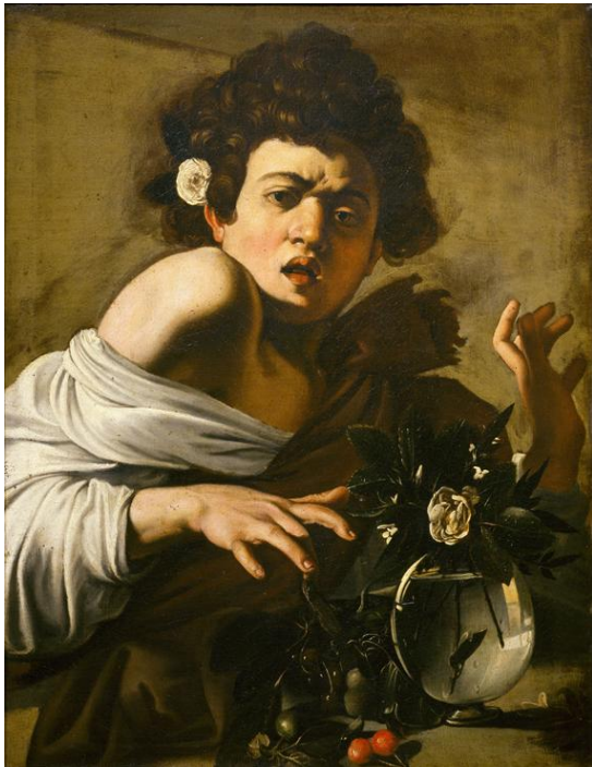
Le Caravage, Jeune Garçon mordu par un lézard , 1594.