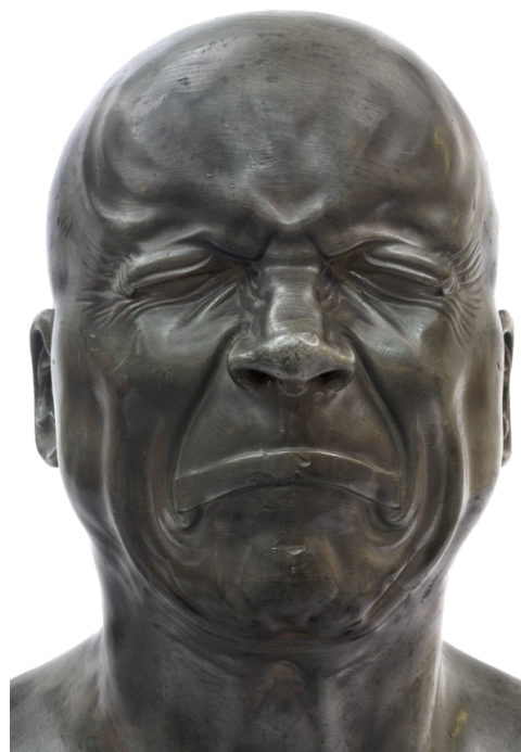
Franz-Xavier Messerschmidt, Têtes de caractère , XVIIIème.