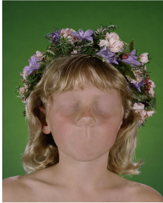
Aziz + Cucher, Dystopia , 1994.