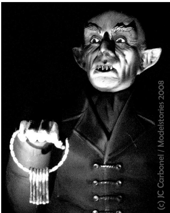
Cinéma expressionniste allemand