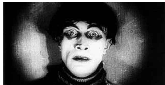
Cinéma expressionniste allemand