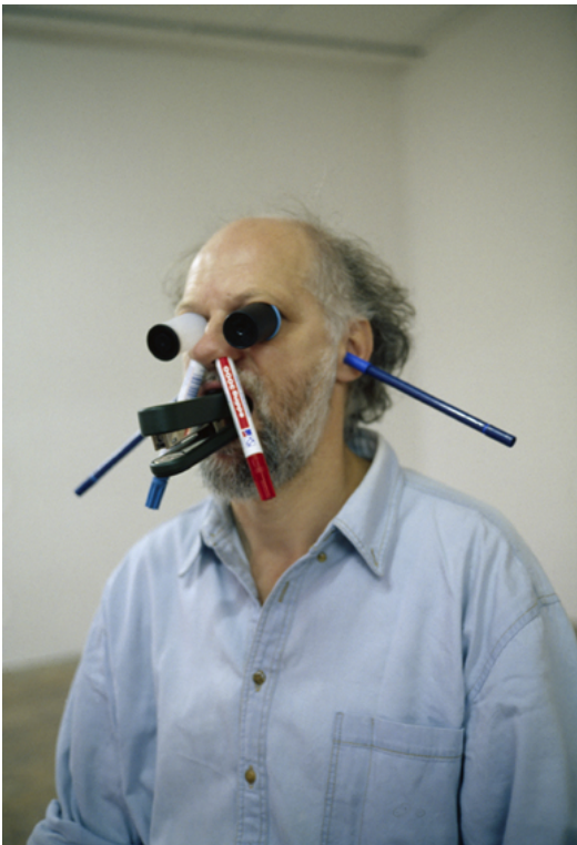
Erwin Wurm, One minute sculpture , 1999.