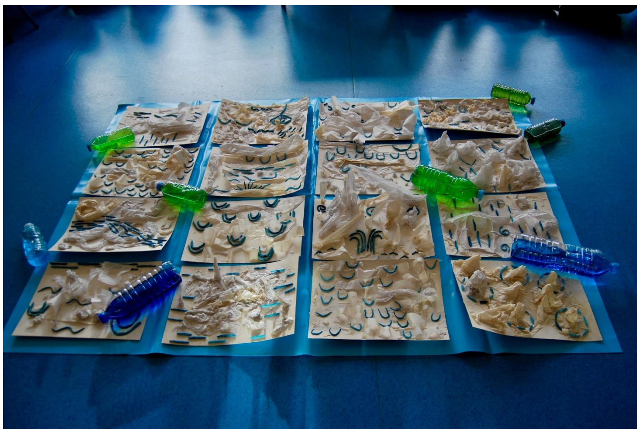
École maternelle de Wattwiller, Coule, bouteilles , collage, pâte à modeler, 2017