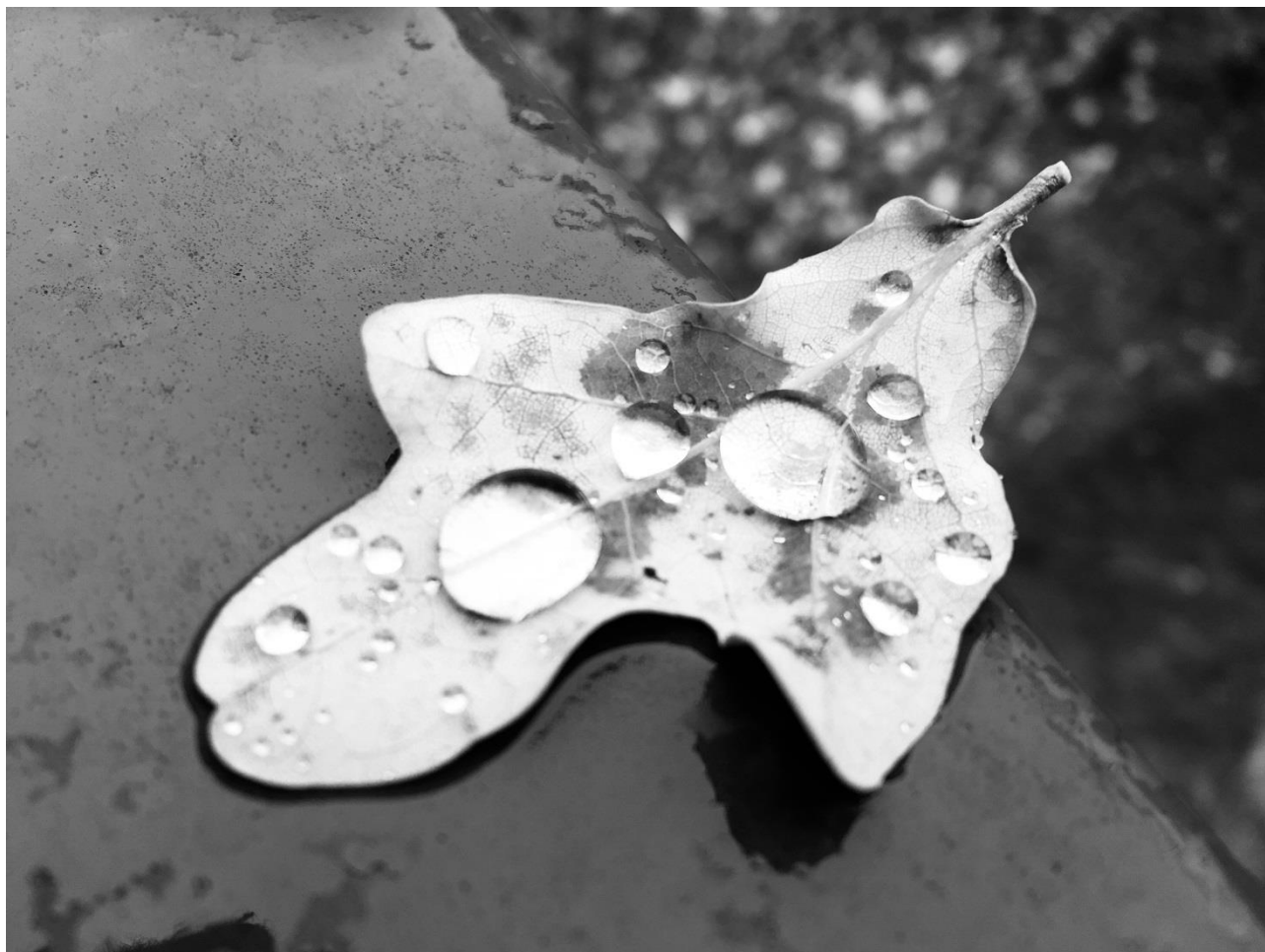
Collège Molière de Colmar, Phot'eaux , photographie numérique, 2017