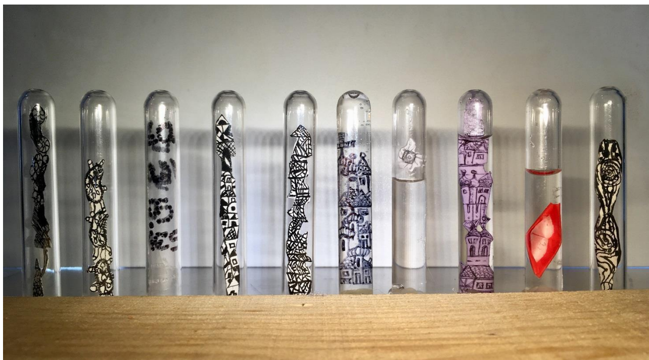
Collège Robert Schuman de Saint-Amarin, EAU 466 , tube à essais, eau, 2017