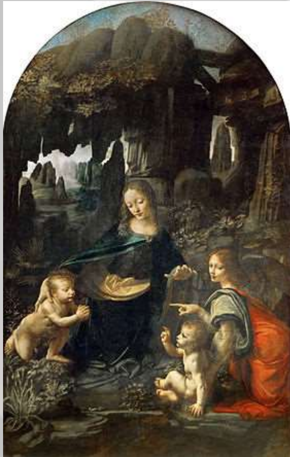
Léonard de Vinci, La vierge aux rochers, 1484, huile sur toile