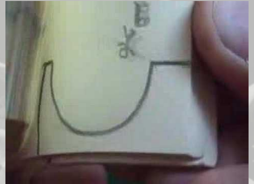
Vidéo Flip mania sur youtube