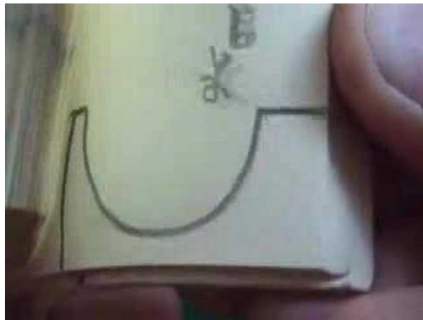
VIDÉO FLIP MANIA SUR YOUTUBE