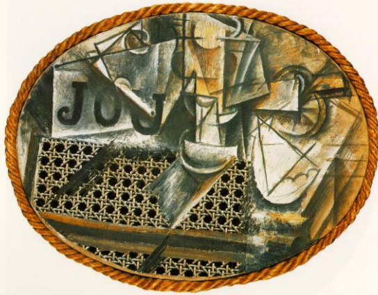
Nature morte à la chaise cannée Pablo Picasso, printemps 1912, Paris Huile et toile cirée sur toile encadrée de corde, 1912