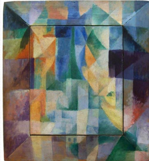
Les Fenêtres simultanées sur la ville Robert Delaunay, 1912 Huile sur toile, 46 x 40 Hambourg, Kunsthalle

Le cadre devient l'œuvre et détermine un champ de vision