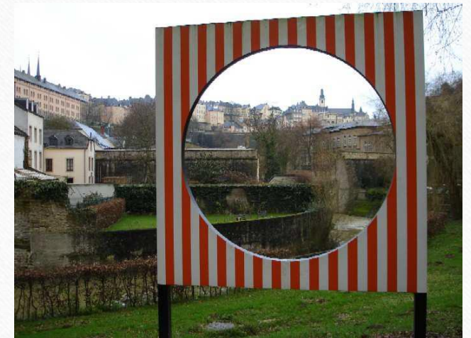
Daniel BUREN « Sha-kkei » ou « Emprunter le paysage » Travail in situ, Ushimado (Japon), Novembre 1985.

Le cadre devient l'œuvre et détermine un champ de vision