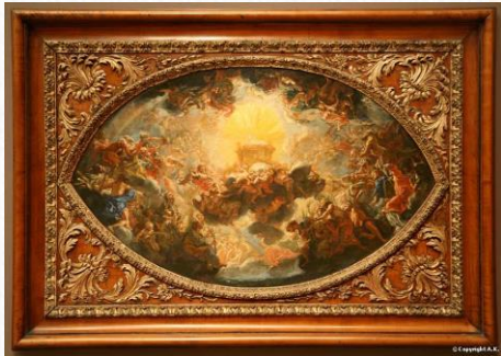
Giovanni Battista Gaulli (Il Baciccio) vers 1680

Le cadre comme objet pour mettre en valeur l'œuvre